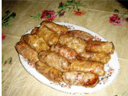
Սուտ կամ պասուց տոլմա

Նոր տարուայ գլխաւոր նախապատրաստութիւններն ուտելիքների շուրջն էին: Տօնի ժամանակ օգտագործուող ուտեստի տեսականին, դրանց ծիսական բնոյթը ընդհանուր առմամբ նոյնական էին հայոց շատ ազգագաւառների համար, սակայն երբեմն տարբերում էին պատրաստաման կերպով, մատուցման եւ ճաշակման ժամանակով, անուններով: Աշնանից սկսած այս տօնի համար պահած ունենում էին զանազան չորացրած մրգեր եւ թարմ մրգեր, պաստեղներ, ընկուզերշիկներ եւ այլն: Պէտք է յիշել, որ Յունուարի 1ը, ընկնելով հայոց ծննդեան տօնի շաբաթուայ մէջ, պաս օր էր, եւ ամանորեայ ուտելիքները բաղկացած էին պասին թոյլատրելի ուտելիքներից: