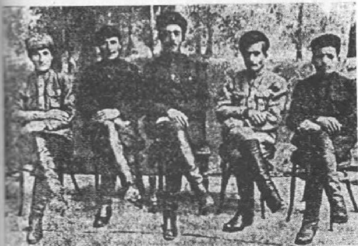
Գ. Նժդեհի զինվորներից