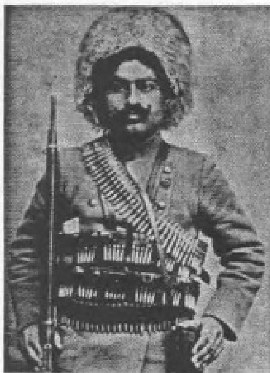
Լեոնա-Յայաստանի Առաջնորդ Գարեգին Նժդեհ