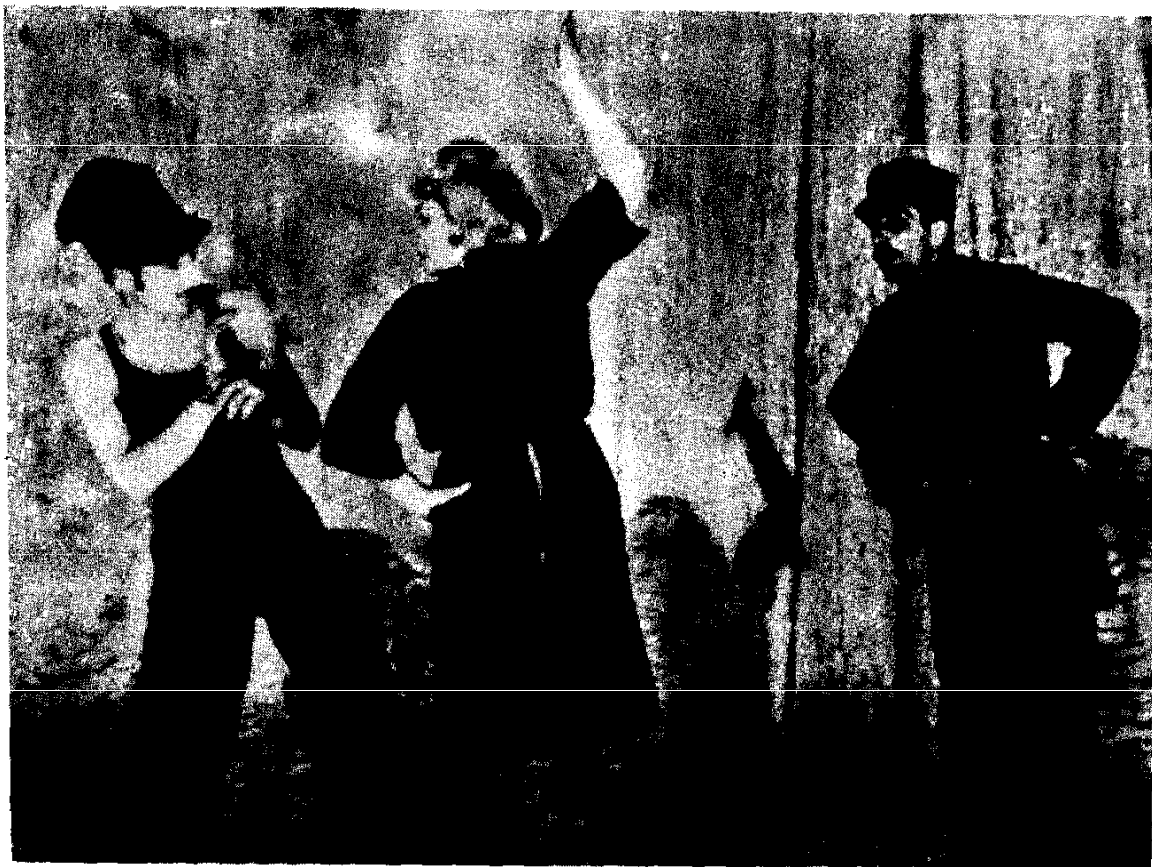
'Շարլը ունկրոի մասնակից