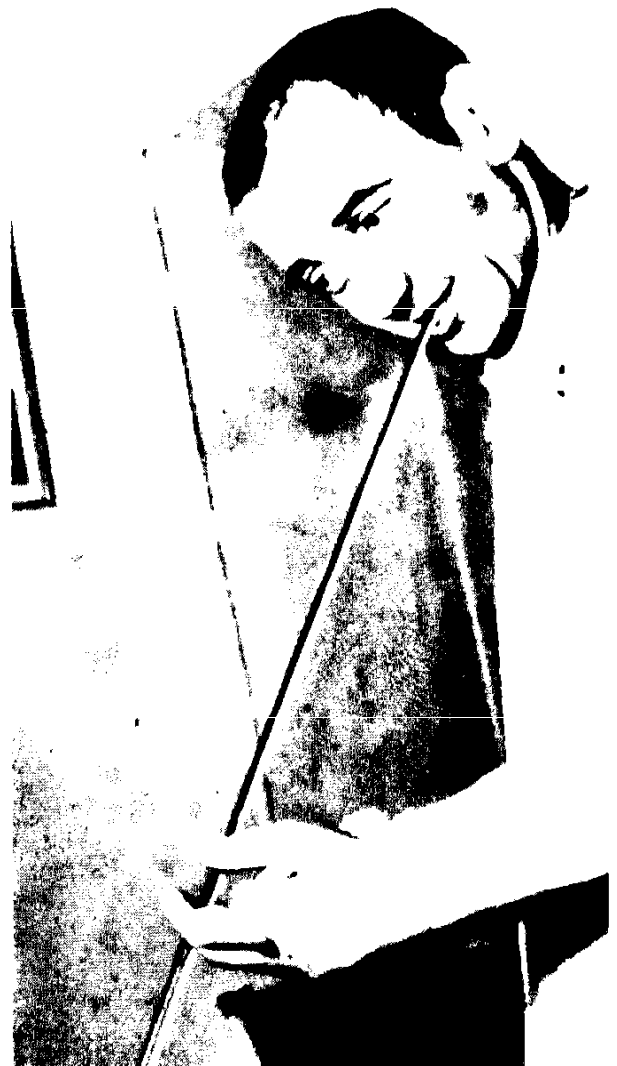
Ավտոլթարի հետևանքով կոտորվում են Ազնավորի թևերը: