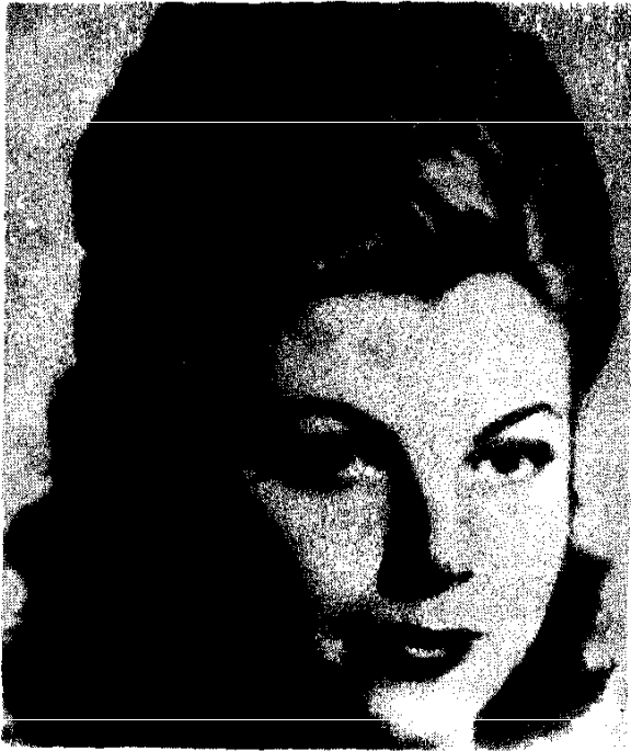
Միշելինը՝ նրա առաջին կինը.