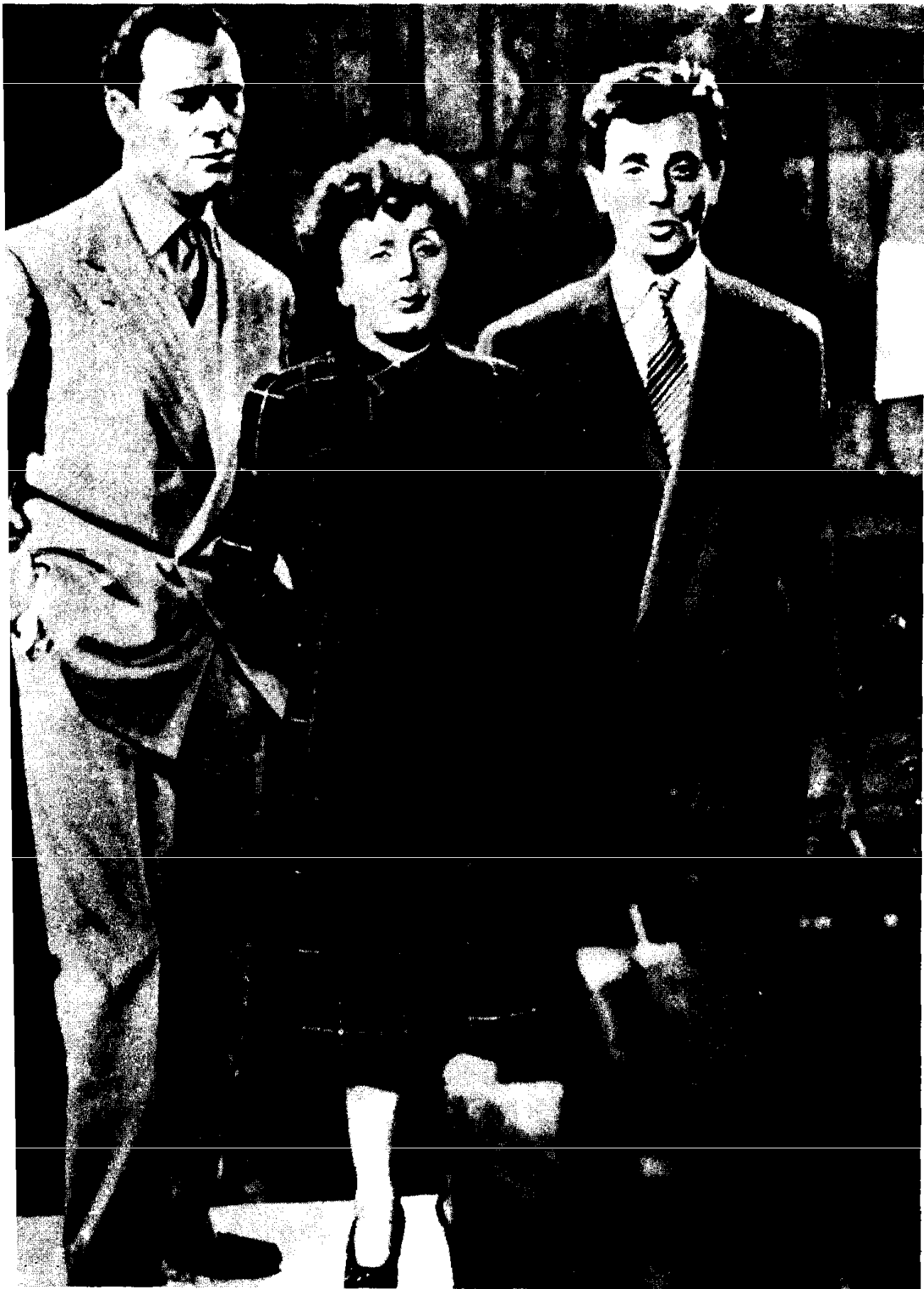
Էդիտ Պիաֆը, Էդիի Կոնստանտինը և Ազնավուրը Քեռուստանտեսյին Էլույթի ժամանակ: