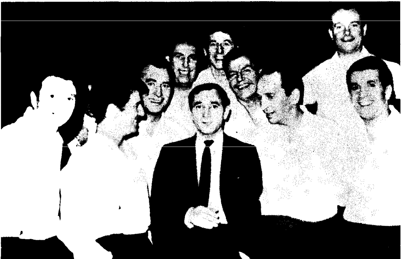
Ազնավորը «կոմպանյոնների» հետ: