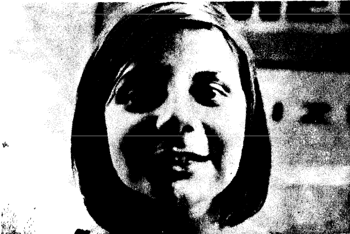
Պատրիցիան՝ Ազնավուրի դուստրը: