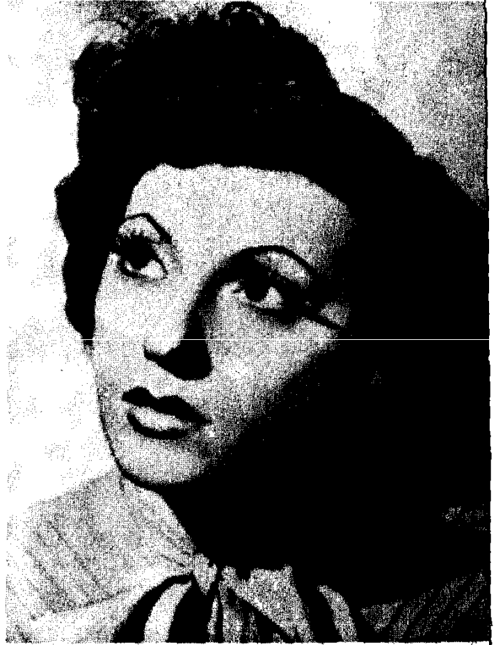
Աիդա Ազնավուրը՝ Մոնրեալու.