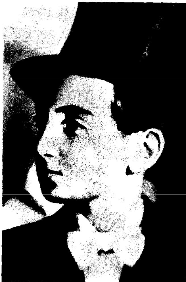
Շարլը տասնմեկ-տասներկու տարեկան հասակում «Պոի մոն» թատրոնում: