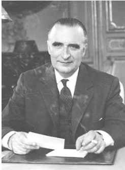
ձ օ՛ւնձ՛ճ՝ օ՛՞

Դը Գոլի հեռացումը գոլական - շարժման մեջ առաջացրեց խորը տարածա-յնություններ: