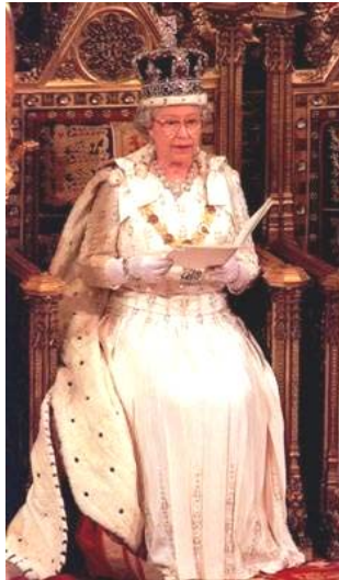
3/4 1/2 μ»Ã II