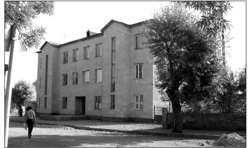
Վարչական շենք Ախալքալաքում

տություն տանել Ախալցխա, երբ այդ ամենը կար Ախալքալաքում կամ մյուս նախկին շրջկենտրոններում: Իրոք, բնակչության դժգոհություններն արդարացի էին, այս հիմքի վրա իրենց գործն արդարացի էին համարում նաև տվյալ շրջանի գործիչները, քանի որ արձագանքում էին բնակչության բողոքի ձայնին: Սակայն ինչպե՞ս: