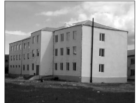
Թբիլիսիի պետական համալսարանի Ախալքալաքի երբեմնի մասնաճյուղի շենքը

բազմապիսի արտոնություններով սովորում էին ոչ թե տեղացի, այլ Վրաստանի մյուս տարածաշրջաններից եկած ուսանողներ, որոնք, մասնագիտանալով տարբեր ոլորտներում, տեղում նշանակվելու էին տարբեր աշխատանքների։ Ախալքալաքի մասնաճյուղի «առաքելությունը» պերճաշուք կերպով ներկայացնում է հենց ինքը՝ մասնաճյուղի տնօրեն, պատմաբան Ռոին Կավրեիշվիլին. «Այս մասնաճյուղը առաջին հերթին, ինչ խոսք, ծառայում էր ինտեգրմանը։ Այստեղ տեղական բնակչության հետ միասին գալիս էին ուսանողներ Վրաստանի այլևայլ տարածաշրջաններից՝ մասնավորապես Սամտրեդիից, Ասպինձայից, Կախեթից, Բաթումից... Մինչ այդ տեղի վրացի բնակչությունը չէր ճանաչում Վրաստանի այլ մասերի բնակչությունը։ Համալսարանի շնորհիվ նրանք բարեկամացան, շատերը ընտանիքներ կազմեցին։ Արևմուտքից ժամանած մասը մնաց Ախալքալաքում. նրանք բաշխվեցին դպրոցներում աշխատանքի։ Այնպես որ՝ համալսարանը իր գործը կատարում էր (ընդգծումը մերն է՝ Վ.Ս.)։ Լուսավորության նախարարության նոր նախագիծը, հավանաբար այս գործը կշարունակի» 6 ։ Իսկ այդ «նոր նախագիծը» վերաբերում էր միասնական բակալավրական ծրագրով քոլեջի ստեղծմանը, որն այժմ Ախալքալաքում արձակում է իր առաջին ծիլերը։