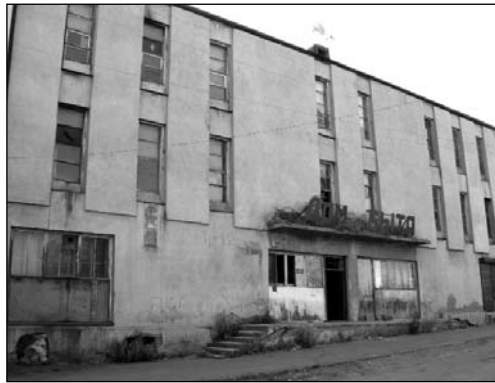
Իլյա Ճավնավաչեի անվան «Յորնա» համալսարանը տեղակայված է այստեղ (ք. Ախալքալաք)

Ներկայումս շատ է խոսվում հայ-վրացական պետական բուհի հիմնման մասին Ջավախքում: Սակայն եթե հարց առաջադրվի այն մասին, թե Ջավախքի ո՞ր քաղաքում, ապա կարելի է լսել տարբեր, ընդ որում՝ իրարամերժ կարծիքներ: Շատերի կողմից հիմնավորվում է այն տեսակետը, որ այդ արդեն «մեծ մեսիան» հիշեցնող բուհը պետք է բացվի Ախալքալաքում՝ որպես