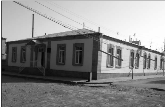
Երևանի Տիգրաս-Ախալաղախական համալսարանի (ԵՏԻ) Ախալքալաքի մասնաճյուղը