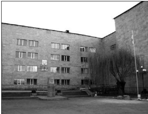
Թբիլիսիի պետական համալսարանի Ախալքալաքի մասնաճյուղի շենքը

Վերջին տարիներին Ախալքալաքում գործում է նաև Իլյա Ճավճավաձեի անվան «Ցոդնա» համալսարանը: Այն ևս մասնավոր հաստատություն է և ընդհանրապես հեռու է ուսուցման համապատասխան որակ ապահովելուց: