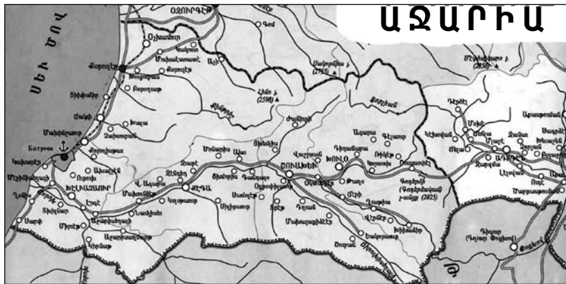
Քարտեզի հեղինակ՝ Գ. Մ. Բաղալյան

Աղիգենից, Քութայիսից, Գորիից և Ջուզղիդիից (մենգրելներ): Բացի այդ՝ Մ. Սահակաշվիլու՝ իշխանության գալուց հետո Աջարիայում սկսվեց եկեղեցիների և ժամատների շինարարության բում, իսկ Պատրիարք-Կաթողիկոս Իլյա 2-րդը դարձավ ինքնավարության հաճախակի հյուրը: Միաժամանակ հեռուստատեսությունը և ռադիոն դադարեցրեցին բոլոր հեռարձակումները, որոնք պատմում էին մահմեդական կրոնի մասին, և նոր հաղորդաշար սկսվեց «Ajaria TV»-ով, որտեղ պատմվում էր աշխարհի բոլոր կրոնների մասին: Աջարական հասարակությունը աստիճանաբար սկսում է տոնել նաև քրիստոնեական տոներ, որոնք Վրաստանում ներկայացվում են որպես ազգային: