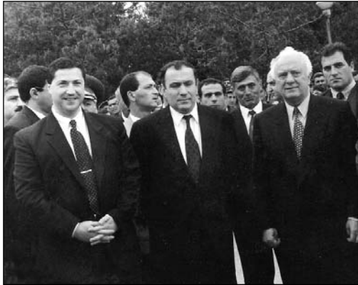
Աչից չափս՝ Վրաստանի Նախագահ Էդուարդ Շավարձնաչեն, Վրաստանի ՆԳՆ Ախալքալաքի վարչության ներկայիս պետը Սամվել Պետրոսյանը, ՀՀ Նախագահ Լևոն Տեր-Պետրոսյանը (ք. Ախալքալաք, 1996թ.)

պաշտոնական հանդիպումներում սկսվեց շոշափվել 1990-ական թթ. կեսերին, երբ ՀՀ նախագահ Լ. Տեր-Պետրոսյանը 1996թ. հունիսին Վրաստան կատարած իր այցի շրջանակներում եղավ նաև խնդրո առարկա Ջավախք տարածաշրջանում 4 : Չնայած Լ. Տեր-Պետրոսյանի 1996թ. այցը ընդհանրապես ուղղված չէր տարածաշրջանի զարգացմանն ու կնճռոտ խնդիրների լուծմանը, այլ կրում էր նախընտրական բնույթ, այնուամենայնիվ այցը եզակի էր այն իմաստով, որ հենց տեղում նախագահների մակարդակով պայմանավորվածությամբ ձեռք բերվեց տարածաշրջանում բացել ինչպես Թբիլիսիի, այնպես էլ Երևանի բուհերի մասնաճյուղեր 5 ։ Սակայն, ինչպես պարզ դարձավ հետագայում, պայմանավորվածությունը ի կատար ածվեց միակողմանի. 2002թ.