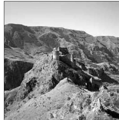
Թմկա անտիկ բերդը Ջավախքում

կայն նույն լեռներից հարավ՝ Ծալկայից մինչև Աջարիայի սահմանները բնակվող հայությանն անհնար է սովորեցնել վրացերենը, եթե անգամ վրացական և միջազգային կազմակերպությունները այդ գործում ներդրեն միլիոնավոր դոլարներ: Այստեղի հայությունը մտածում է նույն մարդու նման և նույն կերպ իրեն զգում իր հայրենիքում: Միևնույն է, Վրաստանը օտար է և չի ընկալվում այս միջավայրում այնպես, ինչպես դարերով հայ ժողովուրդը չի ընկալել հռոմեացու, բյուզանդացու, պարսիկի, մոնղոլ-թաթարի կամ օսմանացու տիրապետությունը: Ծիծաղելի կլիներ, եթե, օրինակ, գտնվելով Օսմանյան կայսրության պետականության կազմում, արևմտահայերը մեղադրվեին օսմանյան ցեղերի միջավայր չինտեգրվելու մեջ: Ավելի ճիշտ՝ դրանում այսօր մեղադրվում են արևմտահայերը, և որը դիտվում է վերջիններիս ոչնչացման պատճառ: Բայց այդ մեղադրանքը ներկայացվում է... պաշտոնական Թուրքիայի կողմից: Այսօր ջավախահայերին չինտեգրվելու մեջ մեղադրող բոլոր շրջանակները վարվում են նույն կերպ, ինչպես ցեղասպանված արևմտահայերի մասին խոսում է Թուրքիան: