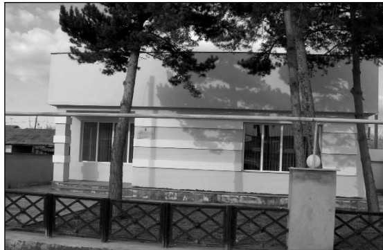
Վրաստանի ֆինանսների նախարարության եկամտի ծառայության Ախալցխայի տարածաշրջանային կենտրոնի (մաքսային հսկողություն) Վճարման ծառայության բաժանմունքի Ախալքալաքի ծառայության ստորաբաժանման (կենտրոն) նորակառույց շենքն Ախալքալաքում

շրջանների վարչությունների նախագահներին, ձեռնարկությունների տնօրեններին, գյուղական վարչություններին, բուժաշխատողներին, ուսուցիչներին «հրաժարվել բոլոր տեսակի պասիվությունից ու անտարբերությունից, տեղերում ակտիվորեն մասնակցել հանրաքվեի անցկացման նախապատրաստական աշխատանքներին ու հանրաքվեի օրը «Վրաստանի կազմում Ջավախքի առանձին քաղաքական ինքնակառավարման միավոր» ստեղծելուն ասել՝ «ԱՅՈՒ» 24 : Ջավախքի հասարակական-քաղաքական կազմակերպությունների կողողինացնող խորհրդի կողմից 1997թ. ապրիլին մշակվել էր նաև Ջավախքի հիմնահարցի լուծման մարտավարության մի նախագիծ 25 , որտեղ Ջավախքի հիմնահարցի լուծման պայքարի քաղաքա-