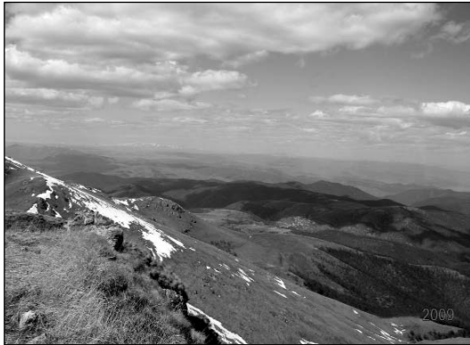
Վրաստանի լեռներից Դմանիսի, հեռվում՝ Ճակայի տեսարանները

հողային աղքատության հետ: Այստեղ միայն հողի խնդիր չկա, այլ և այդ հողերու բնակեցման խնդիր, որ ավելի հրամայական է Հայաստանի- քան որ և է երկրի համար: Վրաստանի մեջ 300.000 հայություն ունինք, որուն մեկ խոշոր մասը տարագիր է, առանց հաշվելու թրքահայ գաղթականներու հարցը, որ այսպես թե այնպես պիտի ծանրանա Հայաստանի վրա: Սակայն ավելի հրամայական պահանջ կդառնա այդ փոքրիկ տարածության Հայաստանի կցելը, երկրի ամբողջականության և Հայաստանի արտաքին աշխարհի հետ կապակցության տեսակետներն: