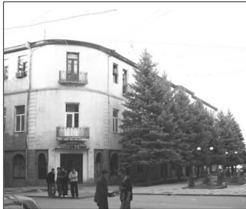
Քաղաք Ախալցխա: Սամցխե-Ջավախքի նահանգապետարանը

Ինչևէ: Նախկին խորհրդային վեց շրջաններից (Ադիգեմի, Ախալցխայի, Բորժոմի, Ասպինձայի, Ախալքալաքի և Նինոծմինդայի) բաղկացած Սամցխե-Ջավախք նահանգը, ստեղծվելով 1994թ. հուլիսի 31-ին, գոյություն ունի մինչ օրս: Նահանգի ստեղծումով մեծապես փոփոխության ենթարկվեցին նաև Ջավախքի վարչական և այլ հասարակական-պետական հիմնարկներն ու տարբեր հաստատությունները՝ ինչպես կառուցվածքային, այնպես էլ՝ աշխարհագրական վայրի գտնվելու իմաստով, որոնք իրենց այս կամ այն ազդեցություն են թողել և թողնում Ջավախքի վրա: Նկատի ունենալով, որ այդ վարչական հաստատությունները մեծ դերակատարություն ունեն Ջավախքը որպես մեկ ինքնուրույն վարչատարածքային կամ ինքնավար միավոր ձևավորվելու գործընթացում, կարևոր է մանրամասն քննության առնել վերջիններիս հետ կապված առկա խնդիրները: Հավելենք, որ դեռ 1990-ականներից ի վեր Ջավախքի հասարակական-քաղաքական կազմակերպություններն ու առանձին անհատներ, այս կամ այն կերպ առնչվելով նշված խնդիրների հետ, հանդես են եկել տարաբնույթ դիրքորոշումներով և համապատասխան արձագանքներով: