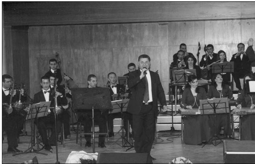
«Արամ Խաչատրյան» համերգասրահ (2007թ., ք. Երևան)

Ծալկան հետխորհրդային տարիներին արագորեն հունաթափ ու հայաթափ եղավ: Հայության պահպանության միակ երաշխիքը ոչ այնքան սոցիալական, որքան մշակութային հիմնահարցի լուծումն է: Հայ մարդը իր հայ մնալու, ինչպես նաև սեփական հողի վրա արժանապատվորեն ապրելու երաշխիքը չունենալով, հեռանում է դեպի ՀՀ և այլ վայրեր: Այս պայմաններում հրատապ հարց է վերակենդանացնել Ծալկայի մշակութային կյանքը: Այդ ուղղությամբ իր կատարած քայլերով վերջին տարիներին աչքի է ընկել «Ջավախք» հայրենակցական-բարեգործական միությունը, որի ջանքերով 2007թ. «Ջավախքի դոկանցներ» համույթը ժամանեց Ծալկայի Այազմա գյուղ՝ մասնակցելու հայ մեծ գուսան Հավասու ծննդյան 110 ամյակի առթիվ կազմակերպված տոնակատարություններին: