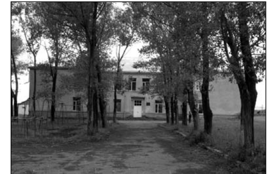
Ռուբեն Տեր-Մինասյանի անվան թիվ 5 միջնակարգ դպրոցն Ախալքալաքում

վելի թանկ են մեր 30-40.000 հայրենակիցները: Եթե Վրաստանը բնավ չուզեր, որ իր ցեղակիցները ինձան Հայաստանի սահմաններուն մեջ, այդ պարագային մենք ալ նույն տեսակետներով պիտի պահանջենք ոչ միայն Բորչալուն, այլ և Թիֆլիզ գավառը և քաղաքը, քանի որ մենք ենք մեծամասնությունը իրենց մայրաքաղաքին և ամբողջ գավառին մեջ: Միայն այդ գավառին մեջ մենք ունինք 92-100.000 հայություն, առանց հաշվելու Վրաստանի այլ մասերու մեջ ձգված 200.000-ի նոտ հայությունը: Եթե մենք բարեկամութեն մղված պատմական, ազգային տեսակետներ հարց չենք բարձրացներ հայացված Թիֆլիզը Հայաստանի մաս կամ միջազգային քաղաք դարձնելու մասին, ինչպես երբեմն կընդունեն ժողովուրդները, ինչու՞ վրացիները մեր արդար, բնական իրավունքներու դեմ երթալով չպիտի գիջեն 7-8000 վրացիներ ձգել մեր սահմաններուն մեջ: Ինչ որ ալ ըլլա. այդ հողամասը ազգագրական տեսակետով բնավ չեն կրնա մաս դառնալ Վրաստանի: Վրացիներն ավելի իրավունք ունին հույները, որոնք մեկ գավառակի մեջ 35 % կկազմեն, իսկ ամբողջը՝ 17.2 %: Հույները բնավ նպատակ չունին ոչ ինքնավարություն ստանալու և ոչ ալ կիստաքրքրվին Հայաստանով կամ Վրաստանով. անոնց հետաքրքրությունը միայն Մեծ Հունաստանն է և անեն կերպ կուզին փոխադրվիլ հոն և արդեն