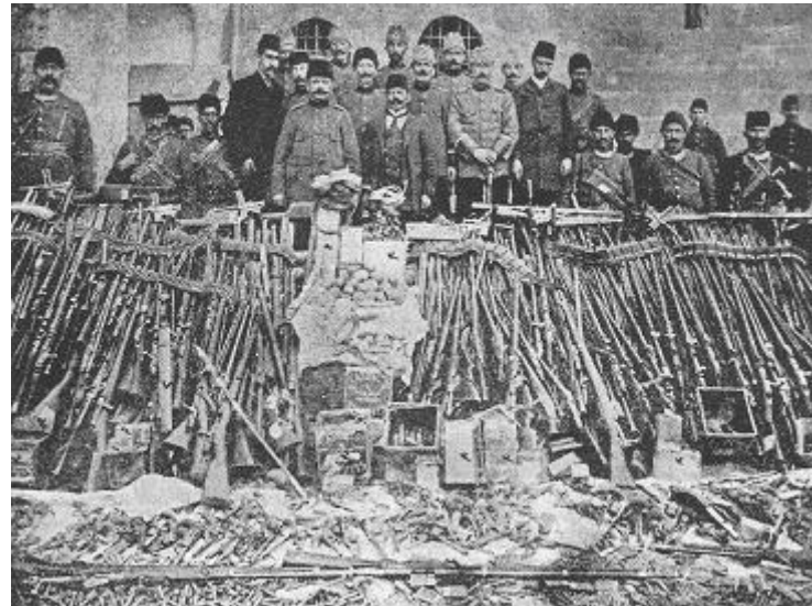
Հայոց տուներու «խուզարկութիւն»ներու ընթացքին «գտնուած» զէնքեր: Նման նկարներ կը գործածուին ցոյց տալու, թէ հայեր ապստամբութեան կը պատրաստուէին:

1915-ի Փետրուարին տրուած հրամանով կը հաւաքուի հայ զինուորներուն զէնքերը, անոնցմով կը կազմուին ծանր աշխատանքի ջոկատներ (ամելէ թապուրու): Անոնք, զանազան վայրեր իրենց տրուած գործերը կատարելէ ու իրենց գերեզմանները փորելէ յետոյ, կը գնդակահարուին: