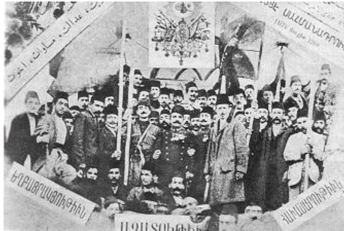
Սահմանադրութեան հռչակման առթիւ Խարբերդի մէջ պատրաստուած նկար

Ապտիւլհամիտ հայերը տնտեսապէս ալ տկարացնելու նպատակով յատուկ օրէնքներ կիրարկել կուտայ եւ զանոնք խիստ հսկողութեան ու քննութեան կենթարկել: