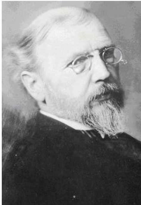
Տօքթ. Եոհաննէս Լէփսիուս

Գերմանացի կղերական Տօքթ. Եոհաննէս Լէփսիուս (Dr. Johannes Lepsius), Պոլիս, ջարդերու կապակցութեամբ տեղեկութիւններ հաւաքելէ յետոյ զանոնք «Գաղտնի Տեղեկագիր» խորագրով կը հրատարակէ: Այս 303 էջերէ բաղկացեալ գիրքը երեսփոխաններուն, եկեղեցականներուն, հանրային գործիչներուն կը բաժնէ: Ան, գրքին նախաբանին մէջ գրած է. «Քրիստոնէութեան ամէնէն հին ժողովուրդը բնաջինջ ըլլալու վտանգին մէջ է...: Հայ ժողովուրդի եօթէն վեցը իր ստացուածքներէն կողոպտուած է, արտաքսուած իր ընտանեկան երդիքէն եւ եթէ չէ իսլամացած, սպաննուած կամ անապատին մէջ տարագրուած է»: Օսմանեան դեսպան Իպրահիմ Հաքքը փաշայի առարկութեան հետեւանքով Արտաքին Գործոց Նախարարութիւնը մնացեալ հատորները կը բռնագրաւէ: Ան գերմանական քաղաքականութեան դէմ չարտայայտուելու խոստումով կը մեկնի Հոլանտա, ուր կը շարունակէ իր մարդասիրական աշխատութիւնները: