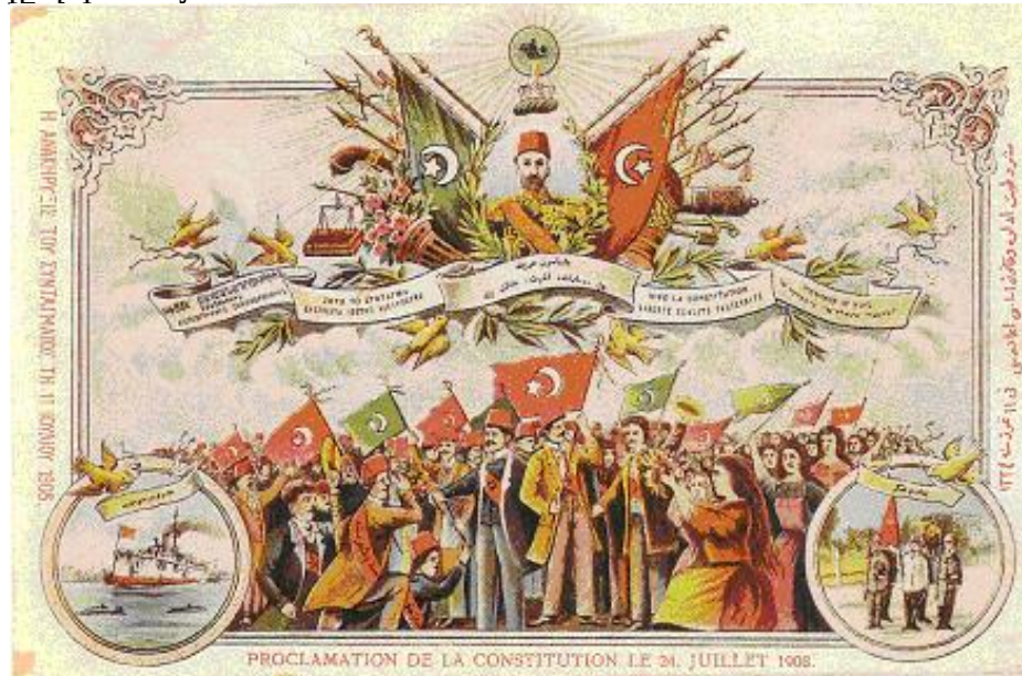
Սահմանադրութեան հռչակման առթիւ հրատարակուած բացիկ. Ժապաւենի վրայ կան 5 տարբեր լեզուներով գրութիւններ

Մինչեւ սահմանադրութեան վերահռչակումը մահմետականը, իր կրօնական հասկացողութեամբ, ինքզինքը միշտ ուրիշներէն գերադաս նկատած էր: Երիտօրօքերու պարտադրութեամբ գործադրութեան դրուած սահմանադրութեամբ ոչ-մահմետական տարրը մահմետականներուն վայելած իրաւունքներուն կը տիրանար: Այս պարագան թէ՛ ժողովուրդի հասարակ խաւերուն եւ թէ՛ պետական որոշ շրջանակներու մէջ դժգոհութիւն կը յառաջացնէ, որով սահմանադրութեան հռչակումով քրիստոնէայ փոքրամասնութիւններուն դէմ եղած ատելութեան զգացումը կը զօրանայ: