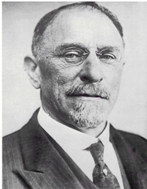
Դեսպան Հէնրի Մորկընթաու

Եւրոպայի քաղաքական վիճակը հասած էր աշխարհամարտի մը նախօրեակին: Որեւէ պատճառ կրնար պատերազմի տեղի տալ: Այդպէս ալ կըլլայ: Աւստրահունգարական Կայսրութեան զահաժառանգ Archduke Franz Ferdinand-ին 28 Յունիս 1914-ին, Պոսնիոյ մէջ սերպերու կողմէ սպաննութիւնը կըլլայ դրդապատճառը: