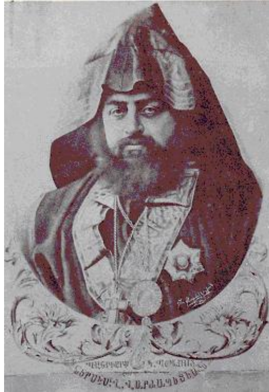
Ներսէս Վարժապետեան Պատրիարք