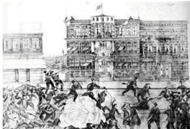
Պանք Օթոմանի գրաւումը (գծանկար)

1894-էն 96 հայաբնակ նահանգներու մէջ մօտաւորապէս 200,000 հայ կը ջարդուի, 100,000 կը մահմետականացուի, 100,000 կին ու աղջիկ կ'առեւանգուի եւ թուրքերու հարեմները կը տարուի: 100,000 հայ Կովկաս, 60,000 Եւրոպա եւ Ամերիկա, 12,000 ալ Պուլկարիա կը գաղթէ: