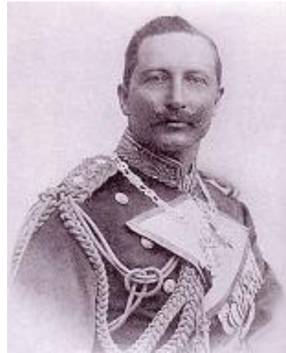
Գերմանիոյ Վիլհելմ Բ. Կայսր

Երբ Գերմանիոյ Վիլհելմ Բ. կայսրը 1889-ի Նոյեմբերին Պոլիս կայցելէ, հայեր առիթէն օգտուելով, աղերսագրով մը իրեն կը յիշեցնեն, թէ Պեոլինի Վեհաժողովի 61-րդ յօդուածը ցարդ գործադրութեան դրուած չէ: Հայերու այս արարքը Սուլթան Համիտին զայրոյթ կը պատճառէ: «Հայկական Հարց»-ը լուծելու գաղափարը իր մէջ բոլորովին կ'արմատանայ: